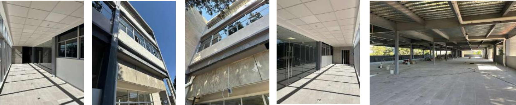
Fotos: 2do. Nivel: suministro y colocación de acabados pintura, loseta, muros para recibir cancelería

OBRA. Terminación de la adecuación del edificio de laboratorios, cubículos y aulas multidisciplinarias de Matemáticas y Física, del Instituto de Ciencias Básicas e Ingeniería (obra exterior)