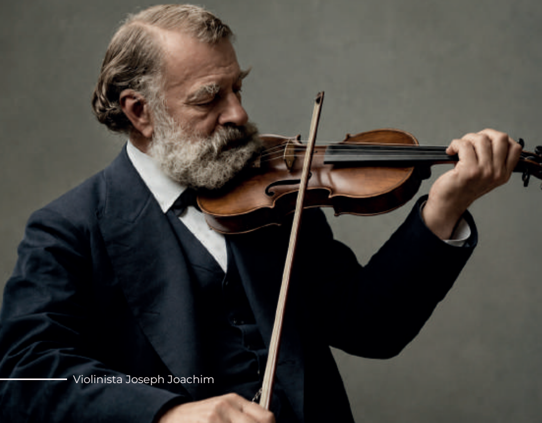
Violinista Joseph Joachim

Tal vez, al momento de la composición de la Obertura, Brahms recordó sus veinte años, en los que pasó dos meses con el violinista Joseph Joachim, tomando un curso de verano en filosofía e historia en la Universidad de Göttingen, donde además de la instrucción y el aprendizaje disfrutaban de asediar las tabernas del lugar y beber en grandes cantidades como si no existiera el mañana.